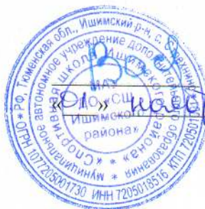
График проведения тестирования физической подготовленности населения Ишимского муниципального района по выполнению нормативов Всероссийского физкультурно-спортивного комплекса «Готов к труду и обороне» (ГТО) на декабрь 2024г.